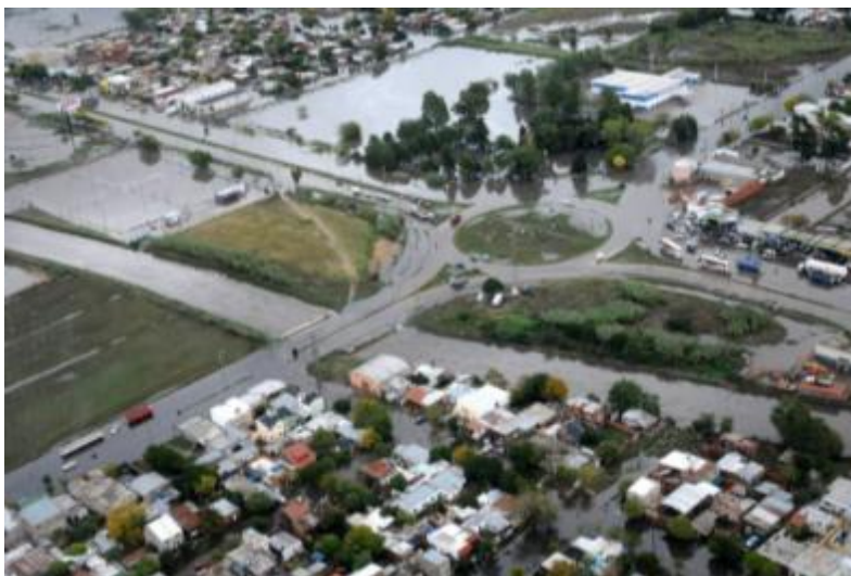
Figura N° 2. Inundación en La Plata. 3 de abril de 2013

Dicha inundación (Figura N° 2) afectó a 3500 hectáreas del área urbana, distribuidas principalmente entre las cuencas de los arroyos Del Gato y Maldonado, que son las de mayor tasa de urbanización, dejando así grandes áreas bajo el agua, inclusive el casco fundacional, lo que afectó a 190.000 personas y causó la muerte de 89 personas.