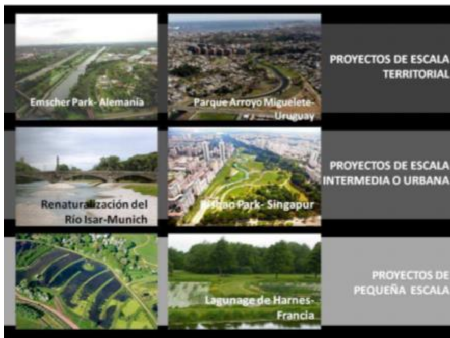
Figura N° 4. Proyectos de paisaje de agua

las áreas urbanas, donde las planicies de inundación se encuentran ocupadas. Esto desempeña un rol central en un territorio con un alto grado de urbanización como el Gran La Plata, en el que el proceso de expansión ha ignorado la necesaria continuidad del agua desde las nacientes de los arroyos hasta su desembocadura en el Río de La Plata, incrementando el riesgo de inundación.