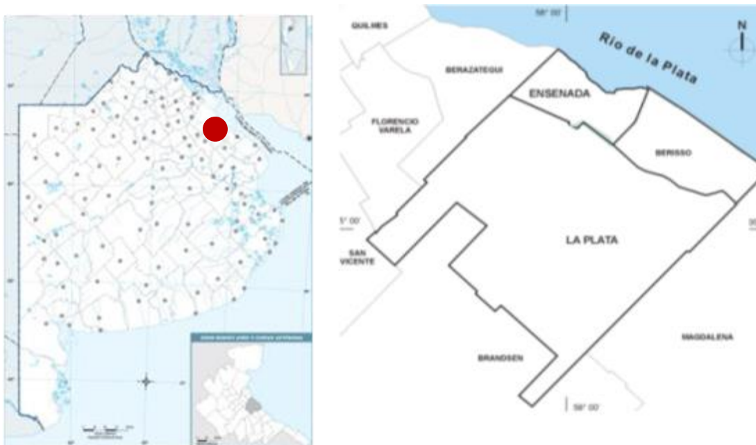
Figura N° 1. Gran La Plata

La Región del Gran La Plata (Figura. N° 1), se ubica sobre el litoral del Río de la Plata en la zona sur del de la Región Metropolitana de Buenos Aires, a una distancia de 60 km de la Ciudad Autónoma de Buenos Aires. Posee una extensión de 1162 km 2 y una población de 787.294 hab (INDEC, 2010). La región está conformada por los municipios de Berisso, Ensenada y la Plata, además de la jurisdicción del Puerto La Plata -ubicada entre los primeros dos- formando una micro Región, dentro de la cual la ciudad de La Plata se constituye en el partido cabecera.