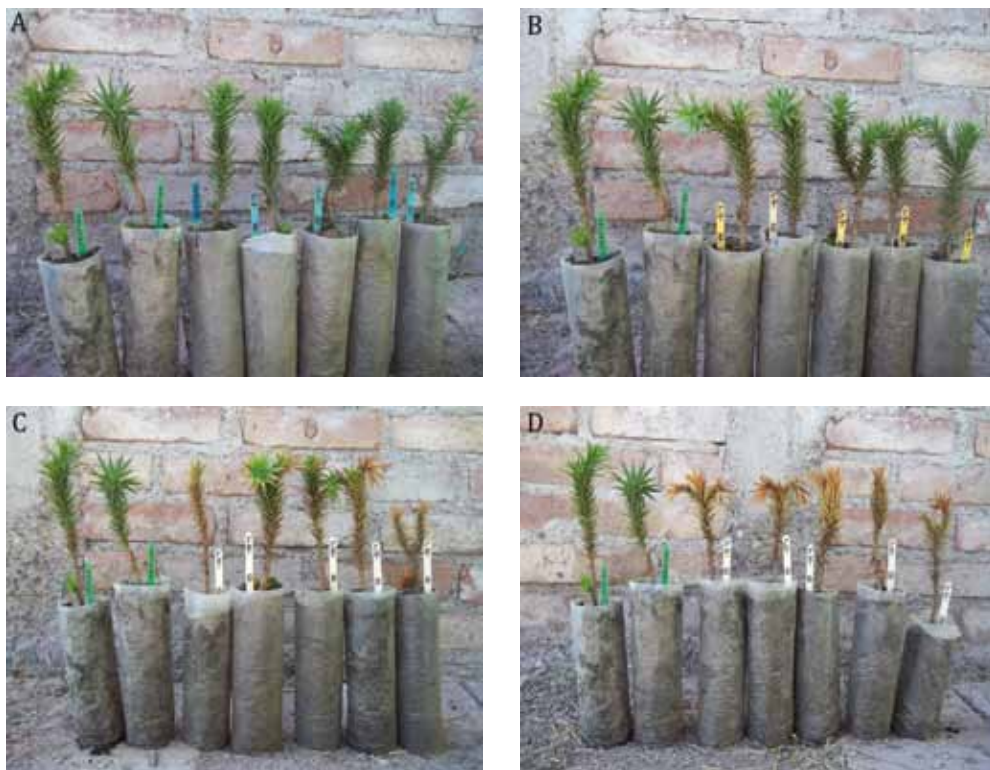
Foto 1. Plantines de Araucaria araucana con diferentes respuestas a distintos niveles de temperaturas de congelamiento. A) tratamiento -2^{\circ}\text{C} ; B) tratamiento -6^{\circ}\text{C} ; C) tratamiento -10^{\circ}\text{C} y D) tratamiento -15^{\circ}\text{C} . En todos los casos, los dos plantines de la izquierda corresponden al control.

Photo 1. Responses of Araucaria araucana seedlings under different levels of freezing temperatures. A) treatment at -2^{\circ}\text{C} ; B) treatment at -6^{\circ}\text{C} ; C) treatment at -10^{\circ}\text{C} and D) treatment at -15^{\circ}\text{C} . In all cases, the two seedlings on the left correspond to the control.