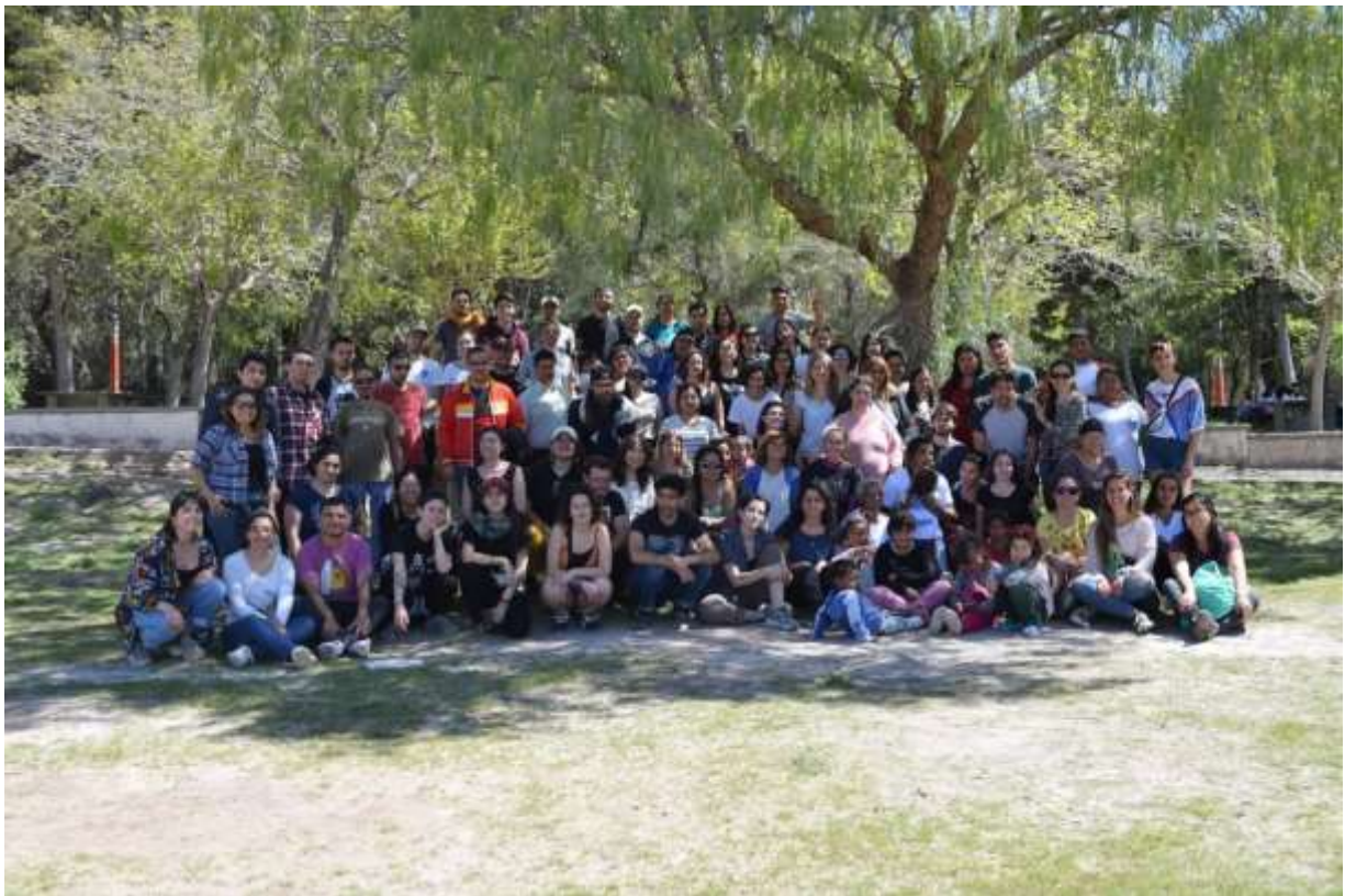
Encuentro de Cierre de Intercambio. Octubre 2019. Mendoza, Argentina.