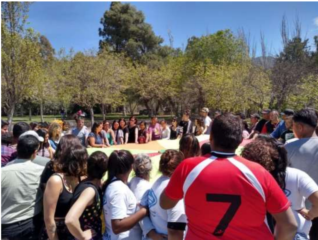
Encuentro de Cierre de Intercambio. Octubre 2019. Mendoza, Argentina.