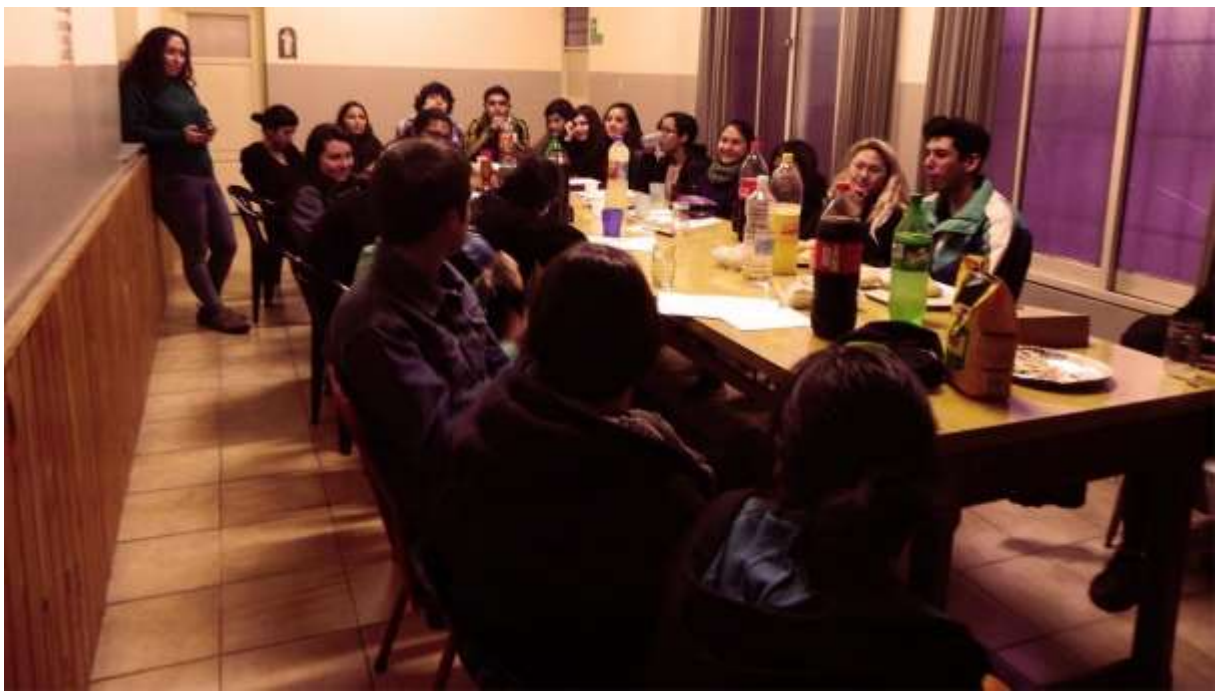
Reunión de bienvenida. Llegada a Mendoza. Septiembre 2017.