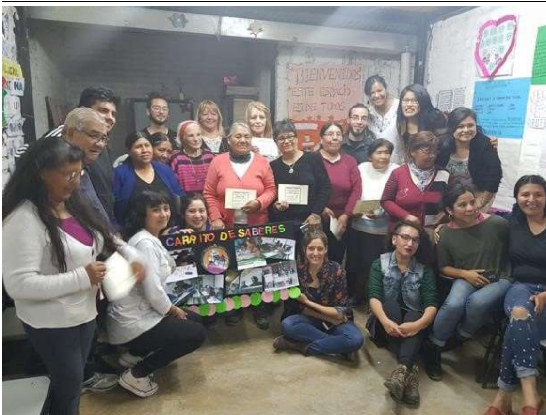
Actividad de cierre con proyecto "Carrito de Saberes", Guaymallén, Mendoza. Octubre 2018.