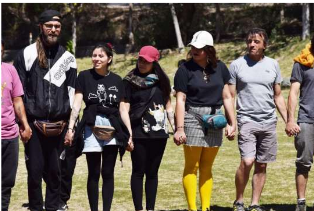
Encuentro de Cierre de Intercambio. Octubre 2019. Mendoza, Argentina.