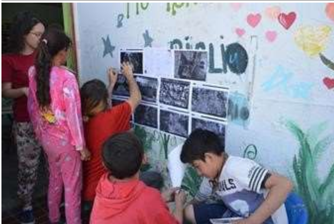
Actividad participativa con niños en el barrio Álvarez de Condarco. Proyecto "Promovernos" . Octubre 2018.