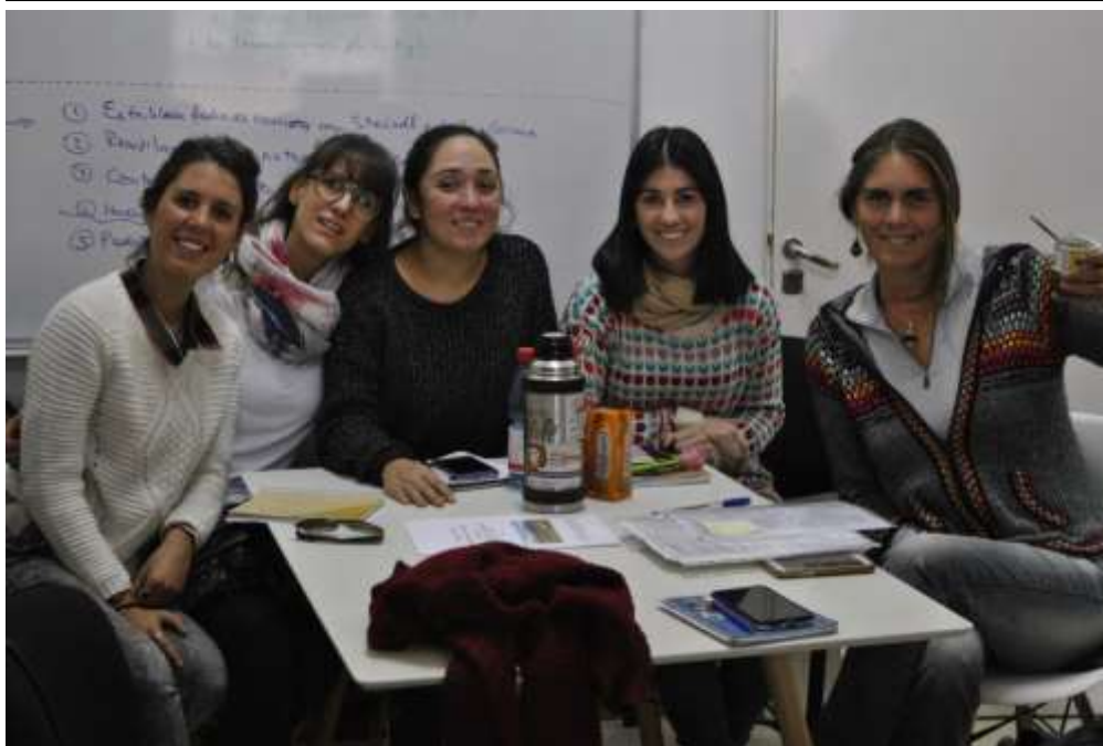
Pre terreno. Reunión con proyecto “Cuencas Vivas”. Junio 2017.