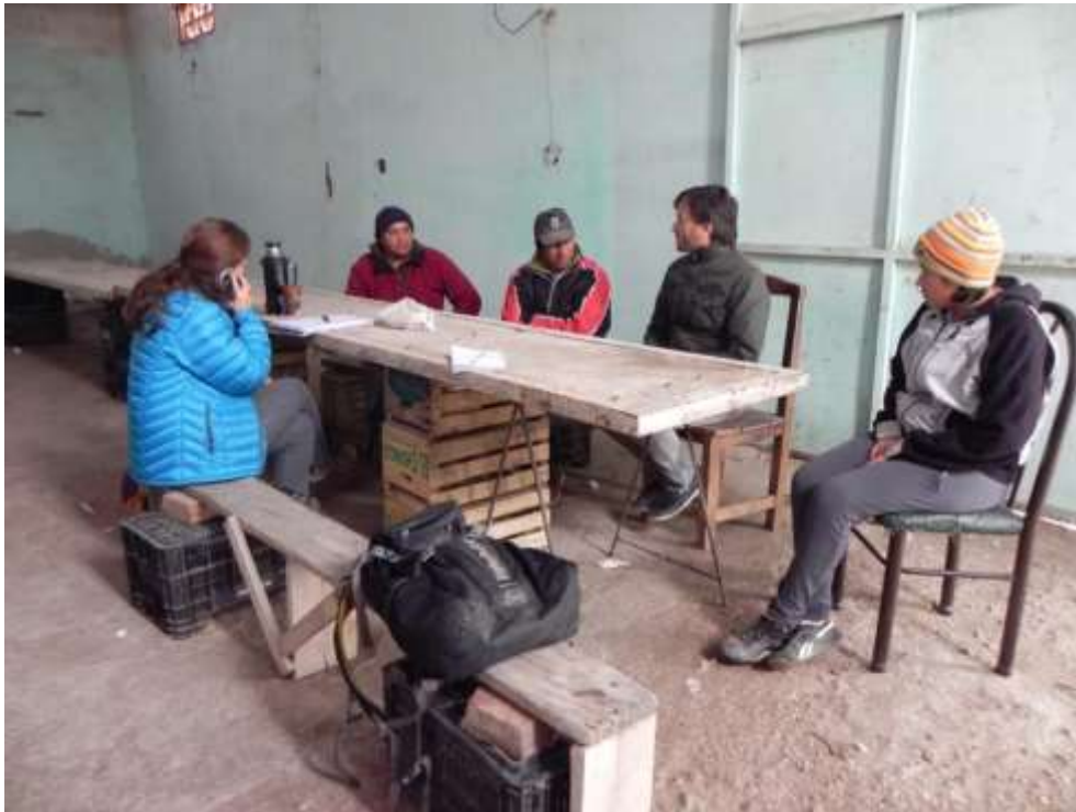
Pre terreno. Reunión con proyecto “Alimentos de la agricultura familiar”. Junio 2017.