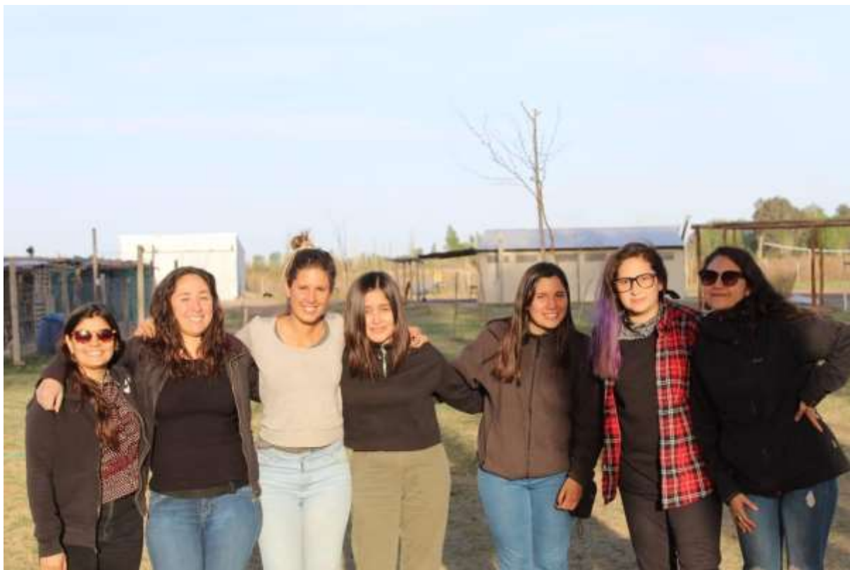
Visita a la Escuela Campesina, Lavalle, Mendoza, Setiembre 2018.