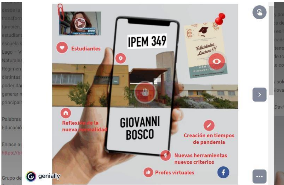
Imagen 3: Esta imagen presentan la entrada del colegio invitando a conocer la institución atravesado por la pregunta ¿Cómo se enseña en ésta escuela en tiempos de ASPO y DISPO?

Imagen 2: Este grupo presenta su trabajo metaforizando en el celular.-